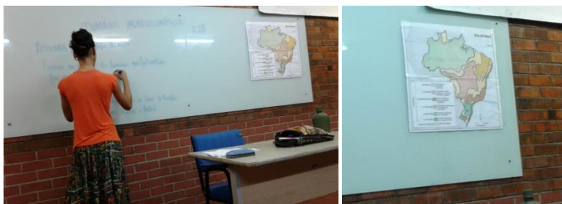
Foto 07: Utilização de Mapa e do Quadro Negro

estagiária da Foto 07 orientou as suas aulas com uso do mapa e, de fato, leu e extraiu as informações nele encontradas.