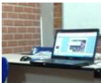
Foto 06: Utilização do notebook para exibir slide

Nas observações das regências nas turmas do NEJAEM/UFPB foi visto que os estagiários utilizaram imagens, vídeos curtos e mapas. No entanto, o quadro negro (a lousa) não foi desprezado. A falta de equipamentos como data-show dificultou a utilização de recursos audiovisuais, mas não impossibilitou, pois os estagiários encontraram formas de superar esse obstáculo exibindo vídeos, imagens e apresentações em PowerPoint através da tela de um notebook (Foto 06) ou de uma TV.