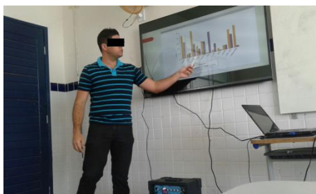
Foto 03: Utilização de Projetores Multimídia