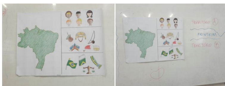
Foto 02: Cartaz Utilizado na Regência

O cartaz (Foto 02) deu outra “roupagem” para a aula, o que a tornou muito mais atrativa. Diante das ferramentas tecnológicas, o cartaz foi caindo no esquecimento. No entanto, pelo que foi visto na regência, continua sendo um importante recurso didático, pois contribui enormemente no processo de ensinagem, uma vez que quando bem elaborado consegue “prender” a atenção dos alunos.